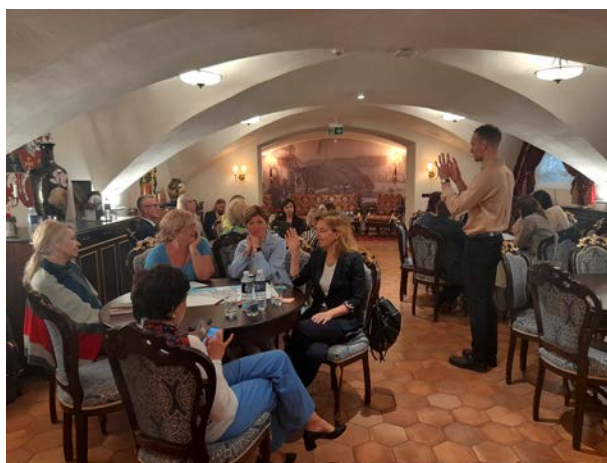
Nuotraukos iš Tauragėje vykusių dirbtuvių