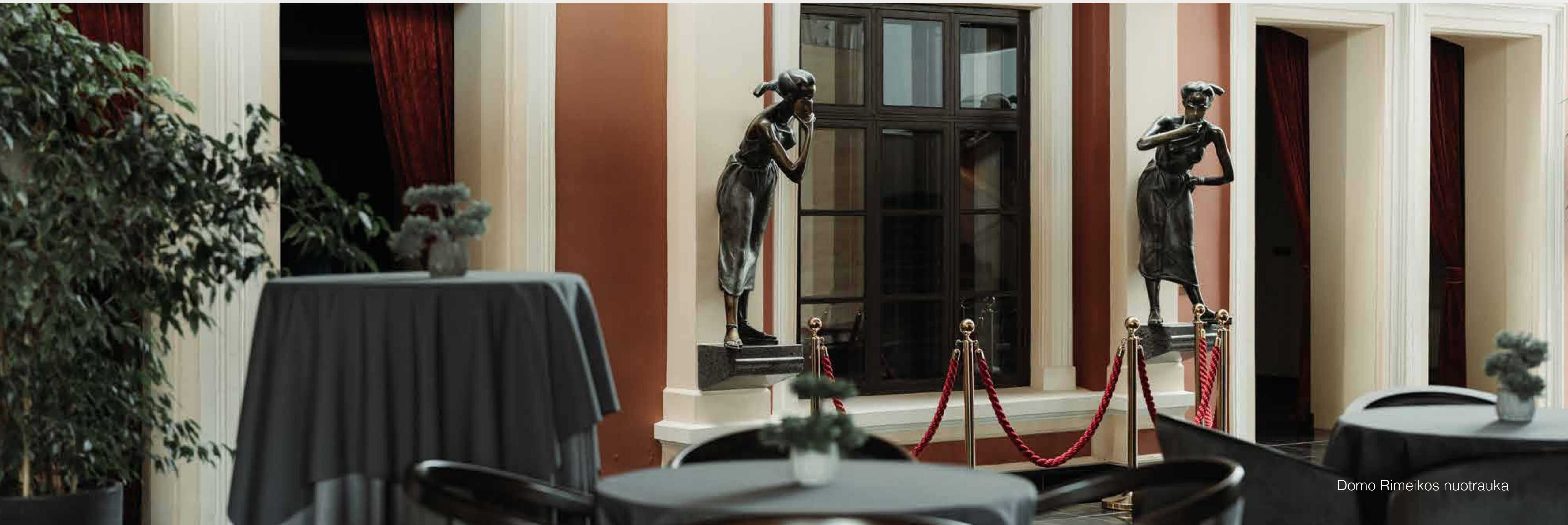
Domo Rimeikos nuotrauka